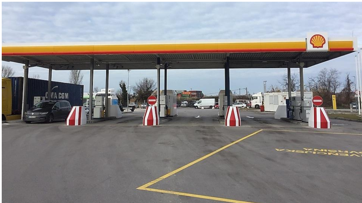
Koper open Shell station Truck

Črpalka se nahaja v smeri Luke Koper ob Bertoški vpadnici, tik ob AMZS